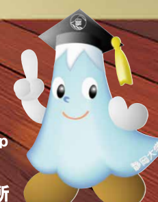
静岡大学キャラクター しずっぴー